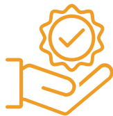
Qualité de services