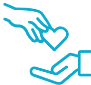
Prestataires fiables et de qualité